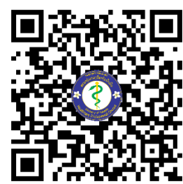
QR Code ລົງທະບຽນອອນລາຍ